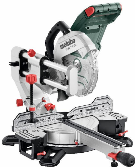
Metabo KGSV 216 MC Kappsäge mit 216-Millimeter-Sägeblatt

Alle Fotos zur journalistischen Nutzung mit Nennung der Quellenangabe zum Abdruck frei.