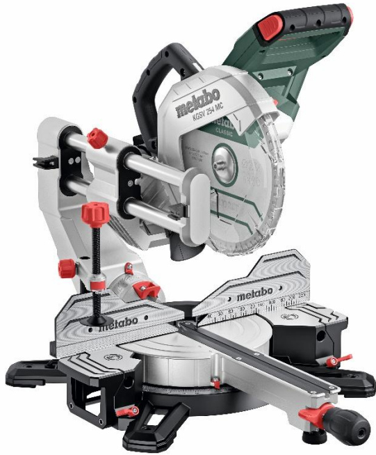
Metabo KGSV 254 MC Kappsäge mit 254-Millimeter-Sägeblatt