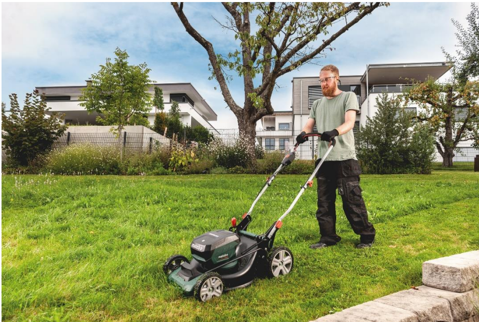
Der neue leistungsstarke Rasenmäher RM 36-18 LTX BL 46 von Metabo eignet sich besonders für große Flächen bis 800 Quadratmeter.