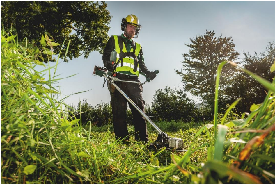
Leistungsstarke Schnitte auch bei anspruchsvollen Anwendungen ermöglicht der neue Freischneider FSB 36-18 LTX BL 40.